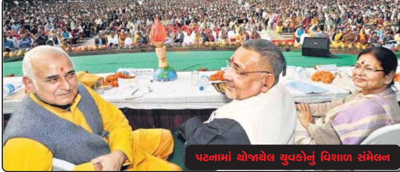
પટનામાં યોજાયેલ યુવકોનું વિશાળ સંમેલન

થઈ સમાજ અને સંસ્કૃતિના વિકાસમાં અગ્રણી યોગદાન આપવા