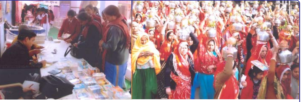
જન ઉત્સાહની ઝાંખિઓ, પુસ્તક મેળો અને કળશ યાત્રામાં કળશ ધારણ કરેલી બહેનો

ભાષામાં ઉપલબ્ધ બધાજ પુસ્તકો તેમને ખરીદ્યા અને આયોજકોના શ્રેષ્ઠ પ્રયાસોની પ્રશંસા કરી. પુસ્તક મેળાએ લાખો લોકોમાં