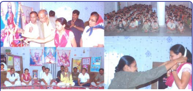
ચલાલા યુગ નિર્માણ ગાયત્રી પરિવાર ટ્રસ્ટ દ્વારા યોજાયેલ કાર્યક્રમની ઝલક