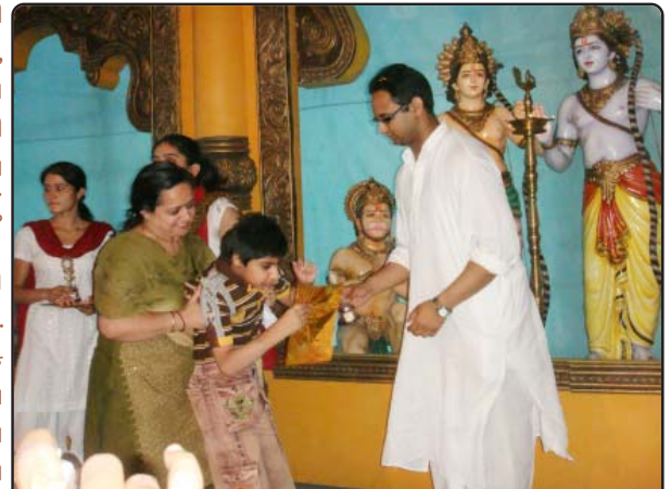
અશક્ત બાળકોને પુસ્કૃત કરી રહેલ શાંતિકુંજ પ્રતિનિધિ

જોઈને લાગે છે કે આજે પણ સેવાના ક્ષેત્રમાં કાર્ય કરવાવાળાઓની કોઈ ઉણપ નથી.