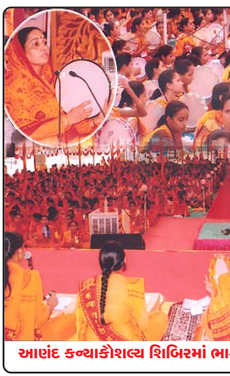
આણંદ કન્યાકૌશલ્ય શિબિરમાં ભાગ લઈ રહેલ સમસ્ત ગુજરાતની બહેનો

આણંદ(ગુજરાત) તા-૧૫ થી ૨૦મે-૧૦ના દિવસે ડી. એન. હાઈસ્કૂલ ગ્રાઉન્ડ આણંદમાં કન્યા કૌશલ શિબિર અને શ્રીમદ્ ભાગવત કથા વૃંદાવન ગ્રાઉન્ડ આણંદમાં ૨૧ થી ૨૭મે-૧૦ના દિવસે