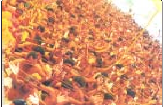
સામુહિક યજ્ઞોપવિત ધારણ કરતા પરિજનો

દાર, બીડી, તમાકુ વગેરે નશા છોડવાના સંકલ્પ લીધા હતા. આ ક્રમમાં ધૂપખેડા પંચકુંડીય ગાયત્રી મહાયજ્ઞ માં