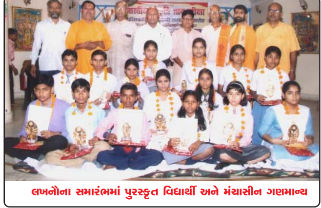
લાખનોના સમારંભમાં પુરસ્કૃત વિદ્યાર્થી અને મંચાસીન ગણમાન્ય

લાખનો(ઉત્તર પ્રદેશ) ભારતીય સંસ્કૃતિ જ્ઞાન પરીક્ષામાં મેરીટ લીસ્ટમાં આવેલ વિદ્યાર્થીઓને તા-૧૧ એપ્રિલના દિવસે સ્મૃતિ ચિહ્ન, પ્રશસ્તિ પત્ર અને સત્સાહિત્ય આપીને સન્માનિત