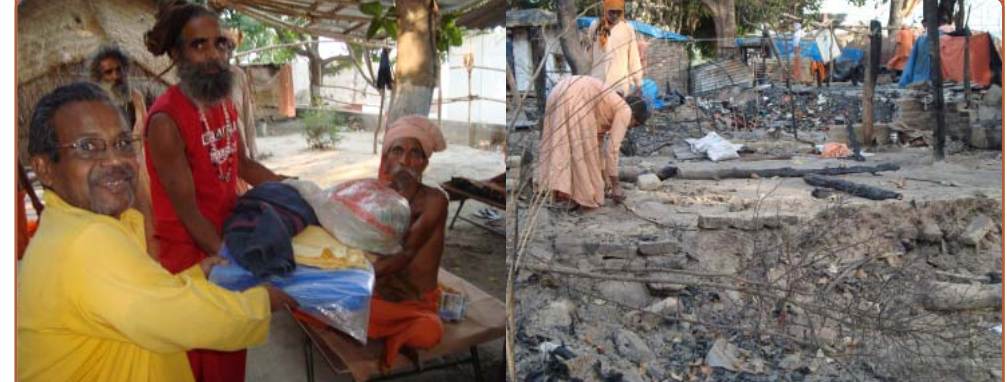
રાહત સામગ્રી આપતા શાંતિકુંજ પ્રતિનિધિ અને ઘટનાસ્થળે પોતાનો સામાન જોતા સાધુ તથા શાંતિકુંજ દ્વારા આપવામાં આવેલ તિરપાલથી તૈયાર થતા રહેઠાણ, જે પાછળ જોવા મળે છે.

હરિદ્વારના સહસરોવર ક્ષેત્રની હોકર નં ૧૨ પર ગંગાતટ પર રહેનારા સાધુઓની ૧૦૩ ઝુંપડીઓ તા-૫ મેના દિવસે બપોરના સમયે ૧૧ વાગે જોત-જોતામાં બળીને રાખ થઈ ગઈ. સાધુઓને માથું ઢાંકવાનું છાપરૂ બાણે ઉડી ગયું અને તેઓ ખુલ્લા આકાશ નીચે રાત વિતાવવા માટે મજબૂર બની ગયા હતા.