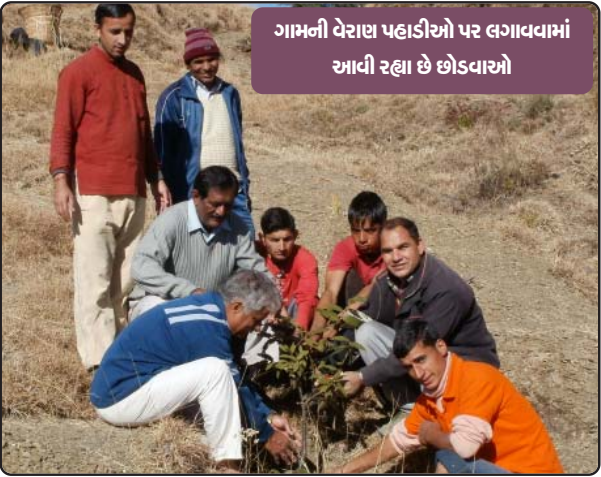
ગામની વેરાણ પહાડીઓ પર લગાવવામાં આવી રહ્યા છે છોડવાઓ

પણ બેટીઓના વિવાહ હોય અથવા ખંડેર મકાનોને તોડીને નવા મકાન બનાવવા, તમામ કાર્ય મજુરીથી નહીં, પરસ્પર સહયોગથી જ કરે છે. દિકરીઓના વિવાહમાં જ્યાં સુધી જાન વિદાય ન થઈ જાય, ગામના લોકો રજા લઈને એ કાર્યને પૂરૂ કરે છે.