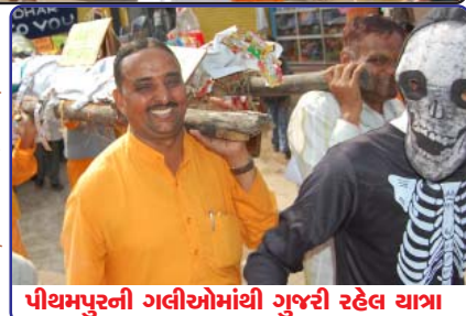
પીથમપુરની ગલીઓમાંથી ગુજરી રહેલ યાત્રા

૨ થી ૪ ડીસેમ્બરની તારીખોમાં પીથમપુરમાં રાષ્ટ્ર જાગરણ દીપમહાયજ્ઞ યોજાઈ ગયો. આ દીપ મહાયજ્ઞના અવસર પર ૨૫૧ યુગલ, ૧૫૦૦ બહેનો અને ૫૦૦ ભાઈઓએ રાષ્ટ્રના નવનિર્માણ માટે સક્રિય ભાગીદારીના સંકલ્પ લીધા. આ સૌએ પોતાના જીલ્લાને સંપૂર્ણ રીતે વ્યસન મુક્ત કરવાના સંકલ્પ લીધા.