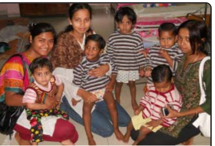
બહેનોએ અનાથ બાળકોની સાથે મનાવ્યો જન્મદિવસ

ઉજવવા વૃદ્ધાશ્રમ પહોંચી અને ત્યાં રહેતા વૃદ્ધોની સાથે મળીને પોતાનો પરિચય આપતાં જન્મદિવસ પર દીપચંદ્ર કરવા અને આશીર્વાદ