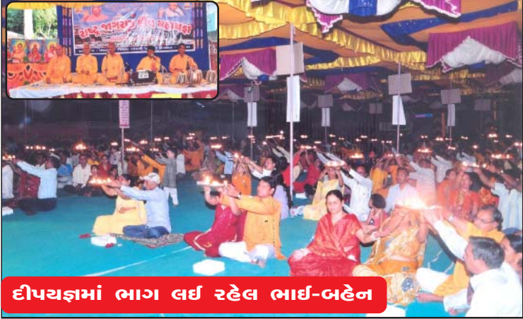
દીપયજ્ઞમાં ભાગ લઈ રહેલ ભાઈ-બહેન

તા-૫ ડીસેમ્બરના રોજ યોગ-પ્રાણાયામના કાર્યક્રમ બાદ વિવિધ સંસ્કારો સંપન્ન કરાવવામાં આવ્યા. ગોધરા નગરના ભુરાવાવ વિસ્તારમાં ૧૨૪ ઘરોમાં એક સાથે સમુહમાં યજ્ઞ સંસ્કાર સંપન્ન થયા. પંચમહાલ જીલ્લાના પરિજનો દ્વારા યજ્ઞો દ્વારા ગુરૂ જન્મશતાબ્દીનો સંદેશ પહોંચતો થયો.