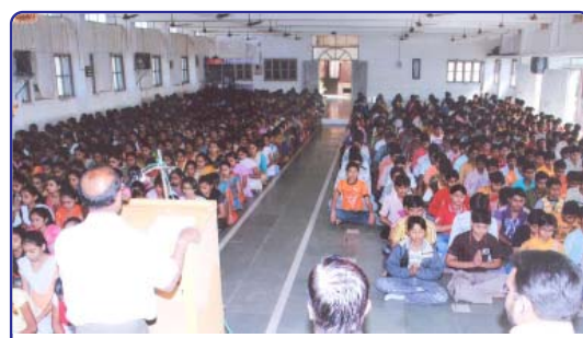
સમારોહમાં પ્રાર્થના કરી રહેલ વિદ્યાર્થીઓ

શ્રી લાયન્સ શાળામાંથી દર વર્ષે ૨૦૦ થી ૩૦૦ ભારતીય સંસ્કૃતિ જ્ઞાન પરિક્ષામાં ભાગ