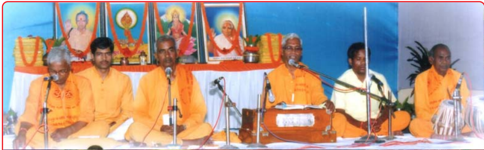
દીપમહાયજ્ઞમાં ભાગ લઈ રહેલ કોરબા (છ.ગ.)ના ભાઈ બહેનો

રાષ્ટ્ર જાગરણ દીપ મહાયજ્ઞના અવસર પર બુદ્ધિજીવી વર્ગના લગભગ ૫૦૦ સંકલ્પિત સાધક દંપતિઓ તથા ૧૦૦૦ અન્ય વ્યક્તિઓએ ભાગ લીધો. જિલ્લા સંગઠને જન્મ શતાબ્દીના વિશેષ અભિયાન અંતર્ગત પાંચ વિકાસ ખંડોમાં ૧૦૮ રાષ્ટ્ર જાગરણ