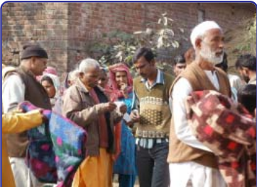
કામળા મેળવીને પાછા ફરી રહેલ ગામવાસી

પાછલા દિવસોમાં હરિદ્વારમાં આવેલ પૂરના સમયે શાંતિકુંજના કેટલાયે ગામોમાં રાહત અભિયાન ચલાવી કેટલાય દિવસો સુધી પૂર પીડિતોની સેવા કરી હતી. તા-૧૯ ડિસેમ્બરના રોજ શાંતિકુંજની રાહત ટીમ ફરી એમની વચ્ચે પહોંચી અને ભયંકર ઠંડીથી બચવા માટે તેમણે રાહત આપવામાં આવી. શાંતિકુંજના આફત પ્રબંધન ટીમે ૩૫૦૦