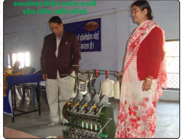
સ્વાવલંબન ઉદ્યોગ આરંભ કરાવી રહેલ પરિષ્કૃત અધિકારીઓ