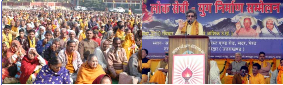
મેરઠમાં લોકસેવી સંમેલનને સંબોધિ રહેલ આદરણીય ડૉ. સાહેબ

મેરઠનું લોકસેવી સંમેલન મુક્તાકાશી હતું. જેમાં બે વિશેષ પ્રયોગો કરવામાં આવ્યા. (૧) આયોજનમાં સાર્વજનિક ફાળો લેવામાં નથી આવ્યો. સ્થાનિક પરિવ્રજનોએ પરસ્પર હળી-મળીને શેતરંજી, માર્ફક, સજાવટ તેમજ મધ્યાહ્ન ભોજનનો ખર્ચ ઉઠાવ્યો. (૨) સંપૂર્ણ આયોજન પ્રાતઃ૧૦ વાગ્યાથી સાંજના ૪ વાગ્યા સુધીમાં સંપન્ન કરી