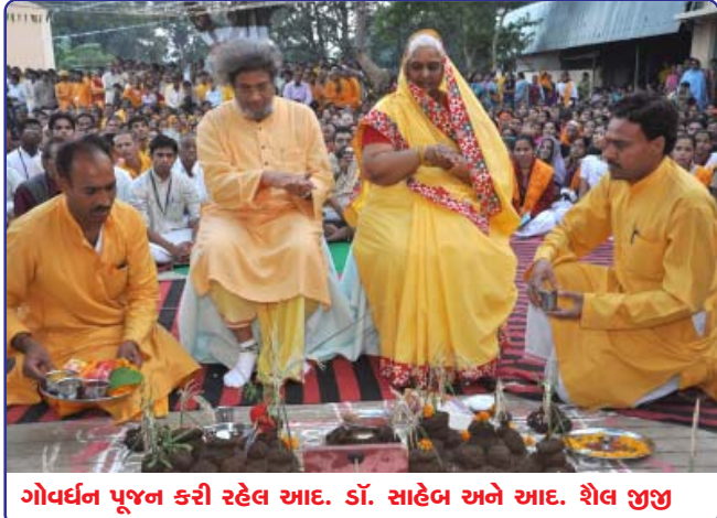
ગોવર્ધન પૂજન કરી રહેલ આદ. ડૉ. સાહેબ અને આદ. શૈલ જીજી

જણાવ્યું કે ગોધન આપણી સમૃદ્ધિ, તંદુરસ્તી, ખેતીવાડી અને ઉત્તમ સંસ્કારોનો આધાર છે. આ સંદર્ભમાં આપણે આપણા ગામોની દરિદ્રતા દૂર કરવા માટે આપણા સમૃદ્ધ