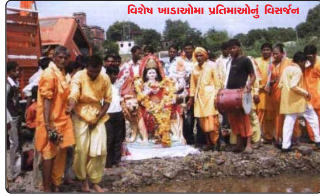
વિશેષ ખાડાઓમાં પ્રતિમાઓનું વિસર્જન

બહુદ, બેડિયાં, કૂડગામ, ઉમરિયા, બાંગરદા વગેરે ગામના ગરબા મંડળો તથા પસ્વિવનોને પ્રશંસનીય