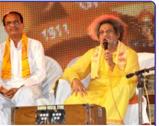
મંચાસીન ડૉ. સાહેબ સાથે મુખ્યમંત્રીજી

તા-૩૦ ઓક્ટોબરના રોજ પુરૂ પાડી રહ્યો છે. આ અવસર પર સાંજના સમયે રાષ્ટ્ર જાગરણ દીપ મહાયજ્ઞાનું આયોજન કરવામાં આવ્યું હતું. મધ્યપ્રદેશના મુખ્યમંત્રી શ્રી શિવરાજ સિંહ સપ્તલીક મુખ્ય અતિથિ હતા. પ્રદેશના કૃષિમંત્રી ડૉ. રામકૃષ્ણ કુસમરિયા, શહેરીવિકાસ મંત્રી શ્રી બાબુલાલ ગૌર, મેયર સુશ્રી કૃષ્ણાગૌર, વરિષ્ઠ જનપ્રતિનિધિ શ્રી ઝા અને ડૉ. ડી.પી. સિંહની વિશિષ્ટ ઉપસ્થિતિ રહી હતી. આ અવસર પર આદરણીય ડૉ. સાહેબે 'શતાબ્દી પુરૂષનું નવસર્જન અભિયાન : યુવાનોનો યોગદાન' વિષય પર પોતાનો સંદેશ આપ્યો.