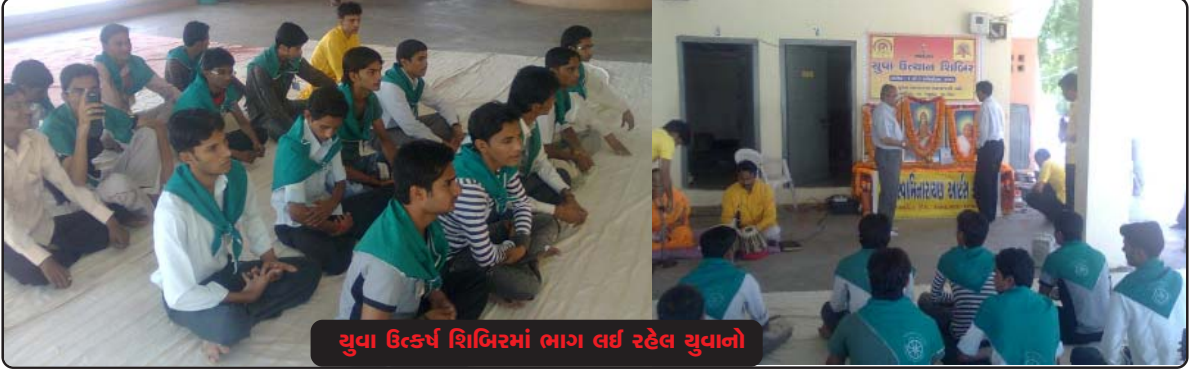
યુવા ઉત્કર્ષ શિબિરમાં ભાગ લઈ રહેલ યુવાનો

માફીયા દ્વારા તેની વનરાજી તથા જમીનનું ખુબ જ નુકસાન કરવામાં આવ્યું હતું, ત્યાં આવેલ શ્રી ઓશો રજનીશ આશ્રમ દ્વારા આબુ બાબુના જંગલ વિસ્તારને છેલ્લા પાંચ વર્ષથી ખુબ જ મહેનત કરી નવપલ્લવિત અને હર્ષોભર્યો બનાવવામાં આવ્યો છે. શ્રી ઓશો રજનીશ આશ્રમના વ્યવસ્થાપક સ્વામી બ્રહ્મવેદાંતજીએ ગાયત્રી પરિવારના યુવા કાર્યકર્તાઓ દ્વારા જ યજ્ઞીય કાર્ય સંપન્ન કરાવવા માટેનો આગ્રહ રાખ્યો હતો.