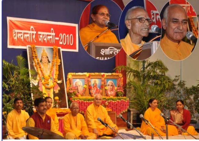
ઘનવંતરી પૂજન સમારોહ : ઈન્સ્ટેટમાં સભાને સંબોધી રહેલા વરિષ્ઠ ચિકિત્સકો

શાંતિકુંજ, બ્રહ્મવર્ચસ અને દેવ સંસ્કૃતિ વિશ્વવિદ્યાલયના સ્વાસ્થ્ય વિભાગો દ્વારા ઘનવંતરિ જયંતી પર ભગવાન ઘનવંતરિની પૂજાનો વિશેષ સમારંભમાં ભાગ લીધો હતો. આયુર્વેદના દેવતા ભગવાન ઘનવંતરિની જયંતી પર શાંતિકુંજના મુખ્ય ચિકિત્સકોએ તંદુરસ્તીની