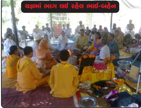
યજ્ઞમાં ભાગ લઈ રહેલ ભાઈ-બહેન

અહીં એ વાતનો ઉલ્લેખ કરવા જેવો છે કે ગાયત્રી પરિવાર યુવા ક્રાંતિદળ હંમેશા યુવાનને લગતી પ્રવૃત્તિઓને ધ્યાનમાં રાખીને સતત