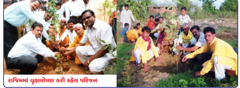
રાજિમમાં વૃક્ષારોપણ કરી રહેલ પરિજન