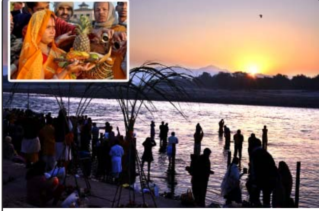
સૂર્યપક્ષી પર્વ પર સૂર્ય પૂજન કરી રહેલ શ્રદ્ધાળુઓ

કાર્યક્રમોને અપનાવવાની પ્રેરણા આપી છે. શાંતિકુંજમાં પણ સેંકડો પરિવારોએ સૂર્યપક્ષી પર્વ આવી શ્રદ્ધા અને ઉલ્લાસ સાથે ઉજવ્યો. પૂજાના સમયે લોકોએ ગંગાતટ પર જપ અને યજ્ઞની સાથે વિશ્વ કલ્યાણની પ્રાર્થના કરી અને આ નિમિત્તે યોગદાનના સંકલ્પ કર્યા. પર્વ પ્રતિ અખૂટ શ્રદ્ધા પ્રગટ કરતાં શાંતિકુંજના સેંકડો કાર્યકર્તાઓએ