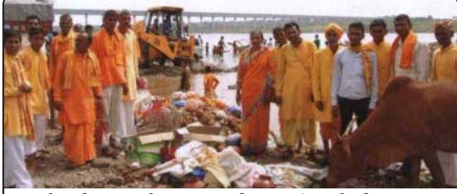
નર્મદાજીને પ્રદુષણથી બચાવવા માટે કરવામાં આવી રહેલ પ્રયાસ

સનાવાદ તાલુકાની વિભિન્ન શાખાઓએ પ્રાદેશિક સંગઠન દ્વારા જાહેર કરવામાં આવેલ પાંચ મહાઅભિયાનમાં પ્રશંસનીય સક્રિયતા અપનાવી રાખી છે. પોલિટેકનિક કોલેજનું પટાંગણ, સનાવાદ, મોરઘડી વગેરે જગ્યાએ શ્રીરામ સ્મૃતિ ઉપવન લગાવવામાં આવ્યાં. સનાવાદમાં આવેલ બાહેલી કોલોનીનું રાધાકૃષ્ણ મંદિર, પછ્યાં વગેરે જગ્યાએ બાળ સંસ્કાર શાળાઓ ચાલી રહી છે. મોટાભાગની ગામડાઓમાં યુવક