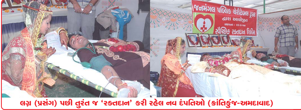
લગ્ન (પ્રસંગ) પછી તુરંત જ 'સ્કતદાન' કરી રહેલ નવ દંપતિઓ (ક્રાંતિકુંજ-અમદાવાદ)

આ સમગ્ર કાર્યક્રમનું પ્રસારણ દૂરદર્શન તથા અન્ય ચેનલો તથા પ્રેસમીડિયા દ્વારા કવચેજ કરી દેખાડવામાં આવ્યું હતું.