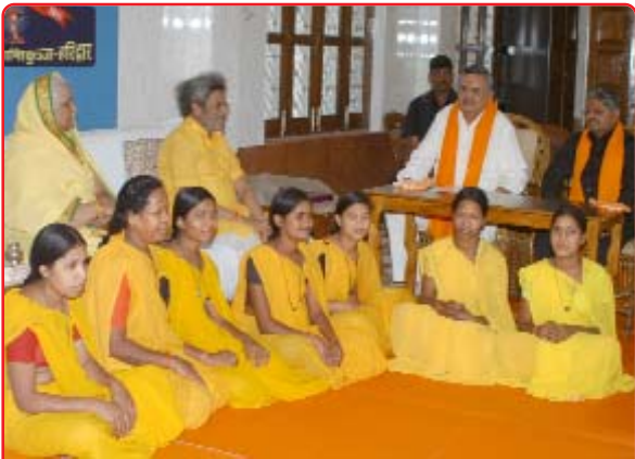
આદ. જીજી-ડૉ. સાહેબ, માન. મુખ્યમંત્રીજી અને વિધાનસભ્ય અધ્યક્ષની સાથે શાંતિકુંજના ભોજનાલયમાં સેવા આપી રહેલ છત્તીસગઢની બહેનો