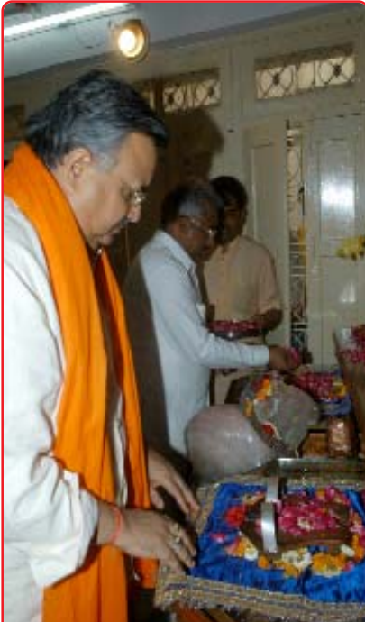
શ્રદ્ધિયુગ્મની ચરણ પાદુકાઓને નમન કરી રહેલ મુખ્યમંત્રી ડૉ. રમણસિંહ અને એમની પાછળ ઉત્તરાખંડના કુંભ મેળા પ્રભારી મંત્રી શ્રી મદન કૌશિક

માનનીય ડૉ. સાહેબે શાંતિકુંજનો પરિચય કરાવ્યો. તેમણે કહ્યું કે ઉત્તરાખંડની જેમ જ છત્તીસગઢમાં દેવ સંસ્કૃતિના વિસ્તારની સૌથી વધારે સંભાવનાઓ છે. પરમ પૂજ્ય ગુરુદેવ-પરમ વંદનીય માતાજી આ ક્ષેત્રને પોતાનું હૃદય સ્થળી માને છે. એ જ પ્રમાણમાં શાંતિકુંજમાં રહેવાવાળામાં ૩૦ ટકા લોકો છત્તીસગઢના છે. તેઓ દરેક ક્ષેત્રમાં આગળ પડતું યોગદાન આપી રહ્યા છે. આપ સૌએ અહીં આવવું સ્વીકાર કર્યું, એ અમારા માટે સૌભાગ્યની વાત છે. આ અવસર પર તેમણે પરમ પૂજ્ય ગુરુદેવની જન્મશતાબ્દીની યોજનાઓ અને કાર્યક્રમો પર સંક્ષિપ્ત પ્રકાશ ફેંક્યો અને તેમાં સહયોગ-ભાગીદારી માટે સૌને આવાહન કર્યું. તેમણે કહ્યું કે આ દિવ્ય ભૂમિમાં ૨૪ કલાકની સાધના અને વિચાર મંથનથી જે નવનીત નિકળશે, તે અદ્ભુત હશે, અવિસ્મરણીય હશે.