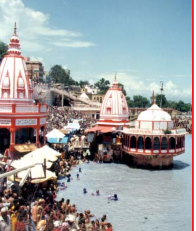
સફળતાઓ કોઈ વાસ્તવિકતાઓ અને સિદ્ધાંતો પર નિર્ભર રહે છે. લૂટમારનો, ઠગાઈનો, જાદુગરીનો આશ્રય લઈને લાંબી પહોળી સફળતાઓ મેળવવી, એનું સ્થિર રહેવું તથા સુખદ પરિણામ મેળવી શકવું સંભવ નથી. ભક્તિ ભાવમાં આવી કોઈ ગુંજાઈશ નથી કે જાદુગરી સ્તરના કંઈક કૃત્ય-કર્મકાંડ પૂરા કરવા માગથી મનોકામનાઓ પૂરી થવા લાગે. દરેક વસ્તુ ઉચિત કિંમત પર ખરીદી શકાય છે. ઈશ્વરની કૃપા પણ એ પુરુષાર્થના માધ્યમથી જ ઉપલબ્ધ થાય છે, જેના પવિત્રતા અને પ્રખરતા જ અવિભાજ્ય પક્ષ છે. (પાના નંબર-૮.૧૮)

આ ચાર છિદ્રોમાં થઈને જ ઈશ્વર પ્રદત અસીમ વૈભવનો સમગ્ર રસ વહે છે અને ઘૂળમાં મળતો રહે છે. જો આ છિદ્રને બંધ કરી શકાય તો બળદી રોકી શકાય છે અને ઈશ્વરથી નિરંતર મળતા રહેનારા અજસ્ર અનુદાનોની પૂંજી એટલી વધારે વધી શકે છે, જેને સત્પ્રયોજનોમાં લગાવી દેવા પર મહાનતાનો લાભ આગામી દિવસથી જ મળવો