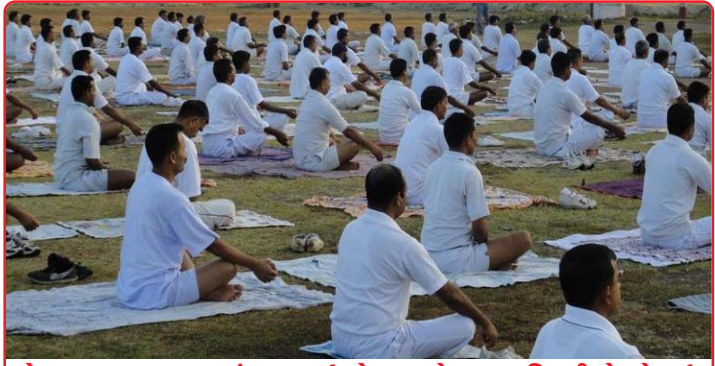
યોગ, ધ્યાન, પ્રાણાયામમાં ભાગ લઈ રહેલ વાયુસેનાના અધિકારીઓ (ચેન્નાઈ)

વિંગ કમાન્ડર અને એર કમાન્ડર સુધીના સૈનિકો અધિકારીઓ સહિત ૨૫૦ થી ૪૦૦ સુધી વાયુ સૈનિક સામેલ થઈ રહ્યા છે. એમને યોગ,